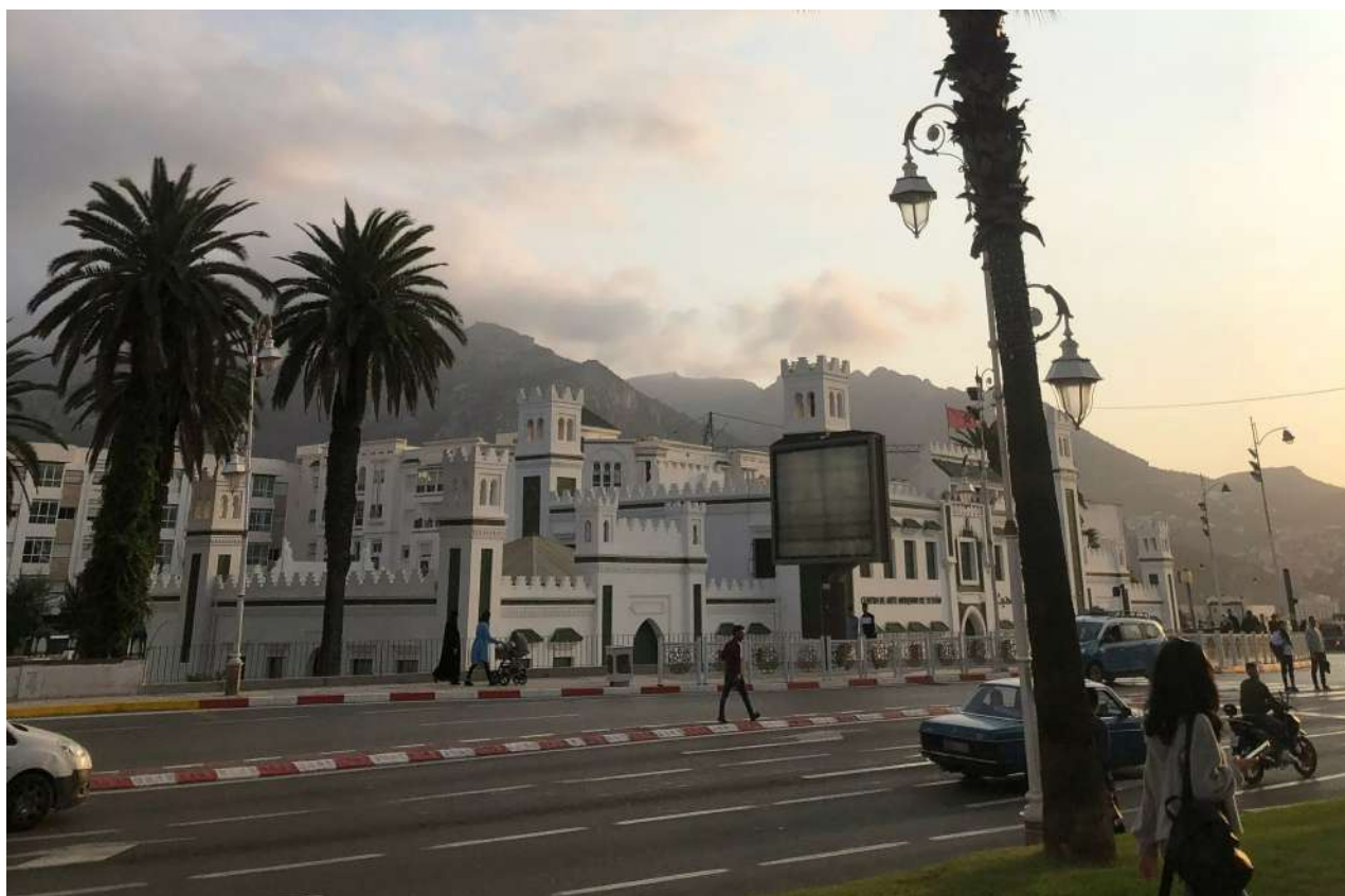
La ville de Tétouan.

Cette distinction, décernée par l'Union et la Fondation Anna Lindh, permettra aux villes d'accueillir tout au long de l'année une série d'activités culturelles qui impliqueront les communautés locales et favoriseront les partenariats dans l'ensemble de la région méditerranéenne, indique l'UpM dans un communiqué.