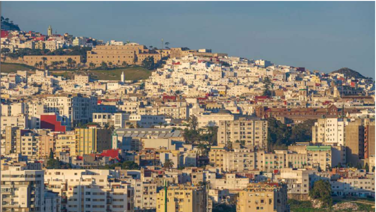
Aerial view of the city of Tetouan, Morocco

'We are fully aware of the challenges and responsibilities that accompany this title, which marks an important turning point for our city. We are convinced that it will be a valuable tool to promote cultural diversity and strengthen artistic exchanges both nationally and internationally,' he added.